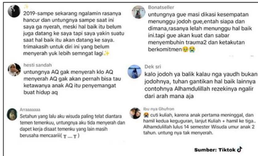
Gambar 1. Komentar para pendengar lagu "Untungnya, Hidup Harus Tetap Berjalan" di Tik Tok

Selain penafsiran terhadap teks, berikut juga diungkapkan respons pendengar terhadap lagu "Untungnya, Hidup Harus Tetap Berjalan". Paparan ini melengkapi tafsiran atas teks yang telah dilakukan di atas. Berikut uraiannya.